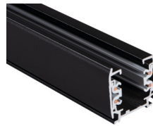
33232 TEAR N TR 2M-W

Sínes rendszer elem, TEAR N TR 2M-W, 3 fázisú sín, fehér (33232)