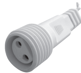
fig. 2. / 2. ábra / obraz 2. / Figura 2. / 2. skica / obraz 2.