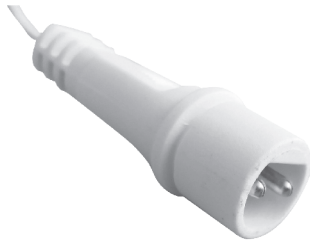
fig. 2. / 2. ábra / obraz 2. / Figura 2. / 2. skica / obraz 2.