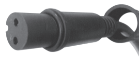
fig. 2. / 2. ábra / obraz 2. / Figura 2. / 2. skica / 2. skica / obraz 2.