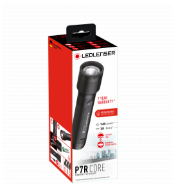
Példa illusztráció a csomagolásra