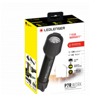
Példa illusztráció a csomagolásra