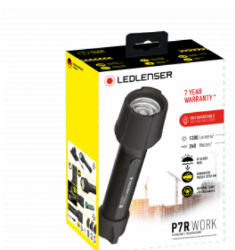
Példa illusztráció a csomagolásra